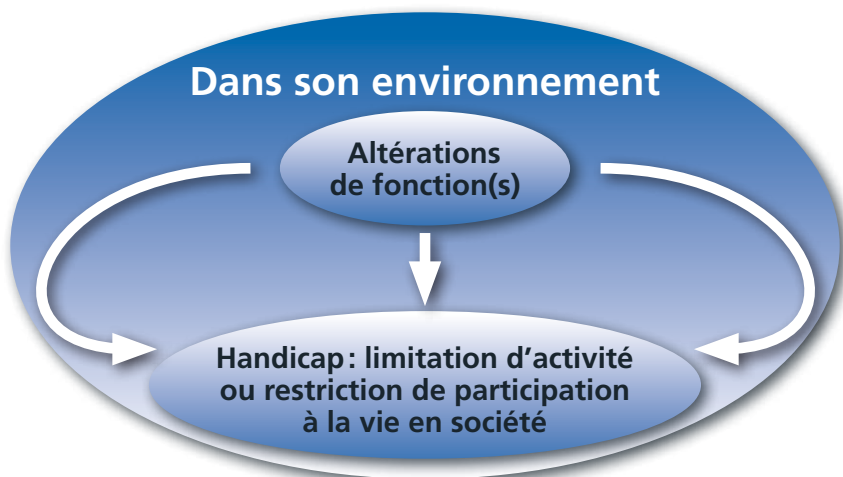
Fig. 2: Définition

Selon cette définition, qui se réclame de la CIF (classification internationale du fonctionnement, du handicap et de la santé – OMS 2001), le handicap ne peut donc plus être uniquement centré sur des caractéristiques personnelles. Étant explicitement défini comme les limitations d'activités et restrictions de participation sociale, il est ainsi le résultat d'une interaction entre deux types de composantes :